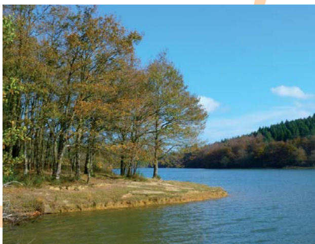
Pantano de Albina

2 [KM 8,5] LEGUTIO. Tomamos el vial que conduce al caserío Goikoerota sin acceder al Núcleo de Legutio, pudiendo desviarnos hasta éste para descansar y reponer fuerzas.