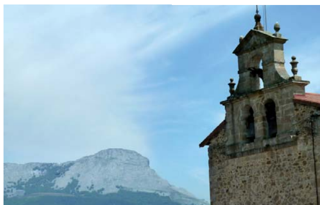
Iglesia de Olaeta