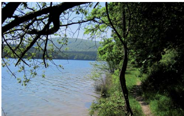
Pantano de Albina