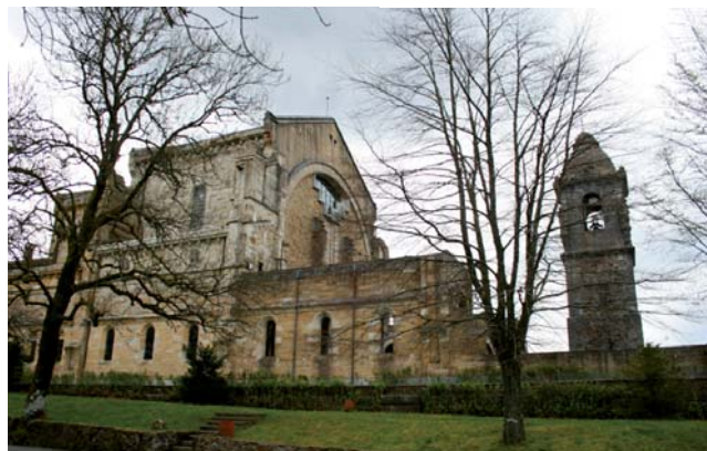
Santuario de Urkiola