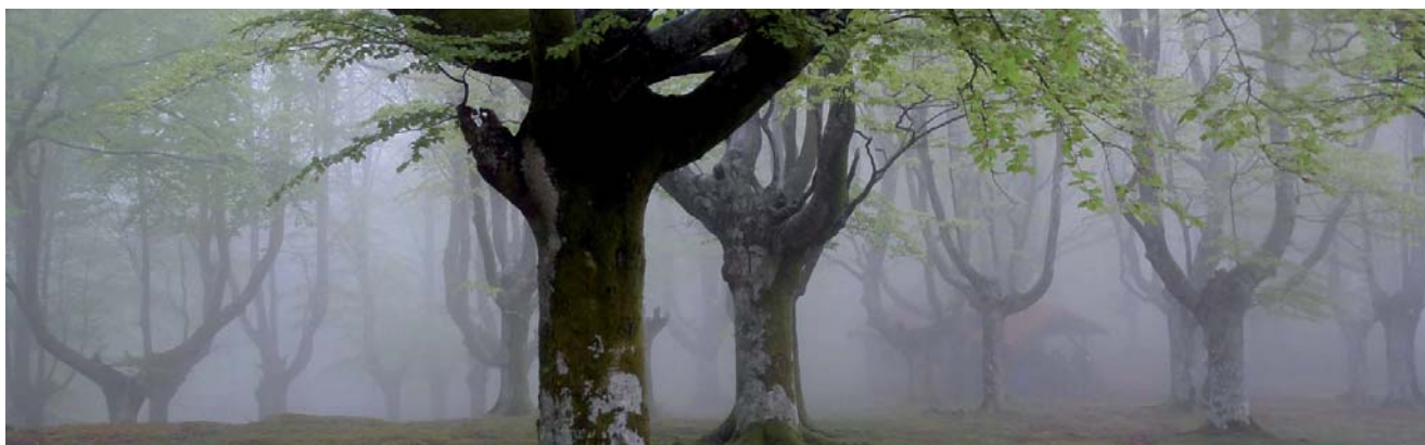
Bosque de árboles trasnochos